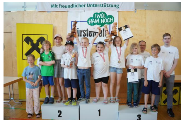
Jubelstimmung bei der ÖM U8/U10

Die Goldmedaille blieb leider aus, aber vier Medaillen sind für die jüngsten unserer Spieler trotzdem eine starke Leistung.