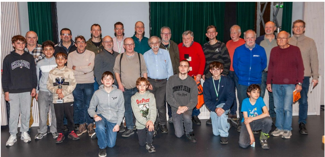
Gruppenfoto: 66. Heilige Drei Könige-Blitzturnier in Trofaiach